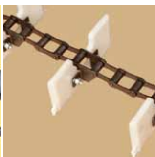
Цепь с очистным скребком.

ОЦИНКОВАННАЯ ЭНЕРГОСБЕРЕЖЕНИЕ ПРИГОДНО ДЛЯ ТЕХОБСЛУЖИВАНИЯ КОМПАКТНЫЙ НАДЕЖНЫЙ ЛЕГКО МОНТИРОВАТЬ