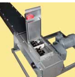
Датчик подпора/смотровая крышка с аварийным выключателем.